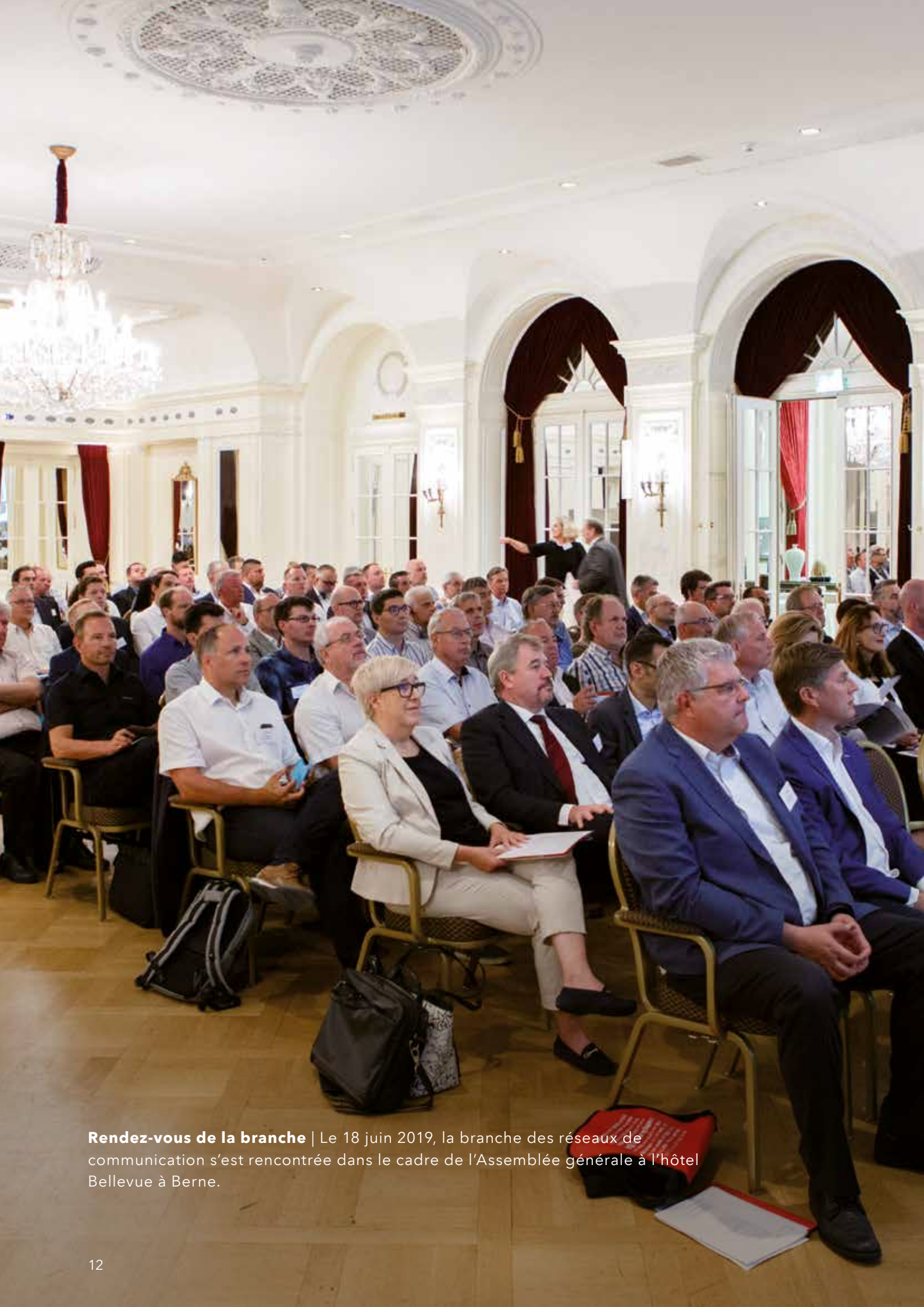
Rendez-vous de la branche | Le 18 juin 2019, la branche des réseaux de communication s'est rencontrée dans le cadre de l'Assemblée générale à l'hôtel Bellevue à Berne.