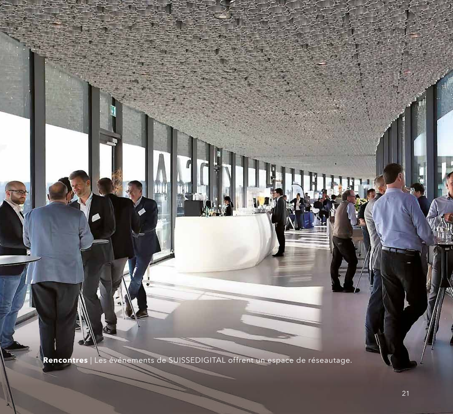
Rencontres | Les événements de SUISSDIGITAL offrent un espace de réseautage.