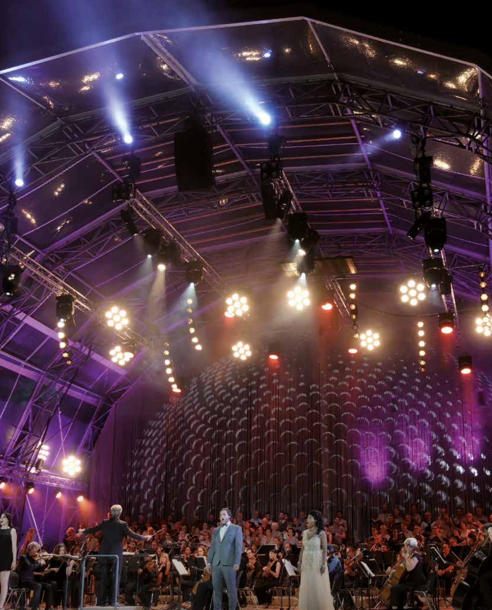
Événement VIP | La représentation d'opéra dans l'amphithéâtre d'Avenches a été le point d'orgue de la manifestation SUISSEDIGITAL VIP, en présence de nombreux représentants du monde public et politique.