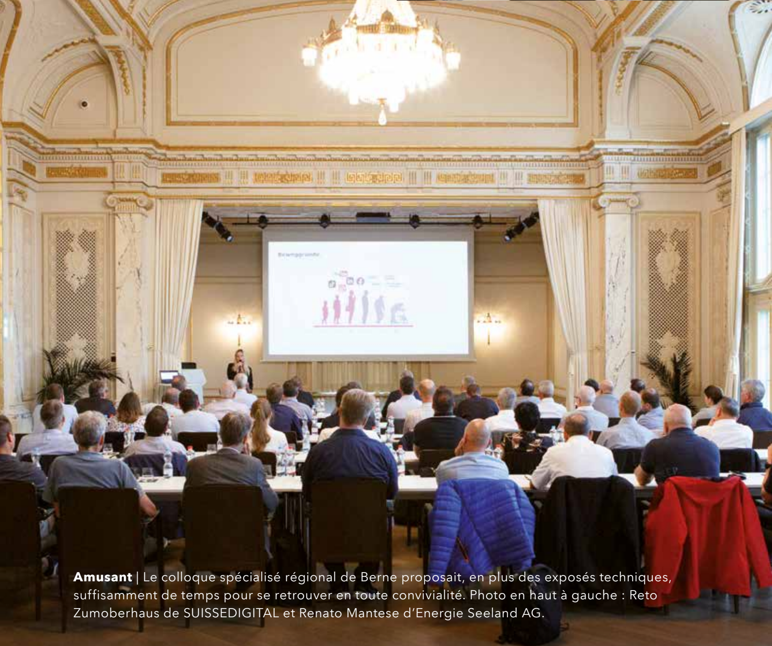
Amusant | Le colloque spécialisé régional de Berne proposait, en plus des exposés techniques, suffisamment de temps pour se retrouver en toute convivialité. Photo en haut à gauche : Reto Zumberhaus de SUISSE DIGITAL et Renato Mantese d'Énergie Seeland AG.