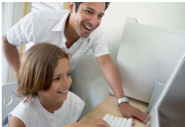
Die Kabel-TV-Dose ermöglicht ultraschnelles Surfen im Internet.

Um maximal vom Kabel-TV-Anschluss profitieren zu können, empfiehlt es sich für Hauseigentümer, die Hausverteilanlage auf dem neusten Stand zu halten. So ist garantiert, dass auch neue Dienste, wie zum Beispiel ultraschnelles Breitbandinternet und HDTV, einwandfrei funktionieren. Interessierte erhalten bei ihrem lokalen Kabel-TV-Anbieter weitere Informationen und eine kompetente Beratung.