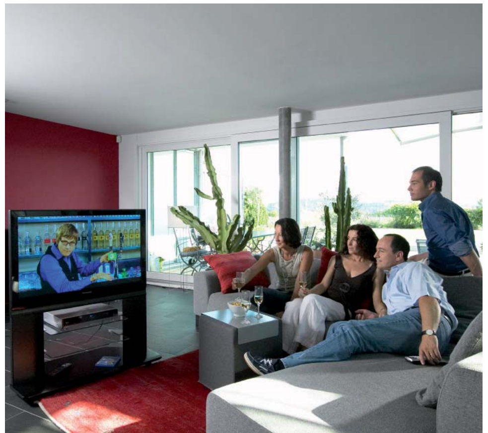
Hochauflösendes Fernsehen (HDTV) ist heute praktisch auf allen Kabel-TV-Netzen empfangbar.