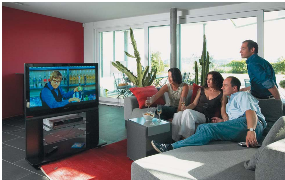
Einstecken und Fernsehen: Die strukturierte, universelle Verkabelung macht's möglich.

Telekommunikations-, Internet- sowie Radio- und TV-Dienste wachsen immer mehr zusammen. Dies stellt neue Anforderungen an die wohnungsinterne Kommunikationsinfrastruktur. Wer ein Haus baut, stellt sich zunehmend die Frage, welche Art der Hausverkabelung zukunftssicher ist.